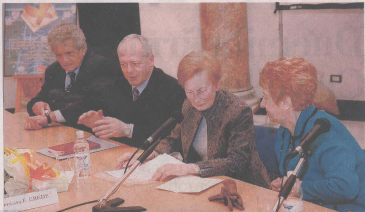
I protagonisti della presentazione ufficiale della Fondazione

DEBUTTA UN CONCORSO PER COLORO CHE AMANO LA FILOSOFIA